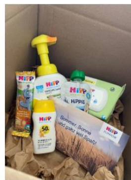
Sommerpakete für die neuen Azubis

Azubi-Blog | Sommerpakete für die neuen Azubis